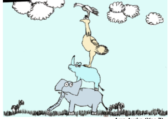
Arın Aydın (Yaş 7)