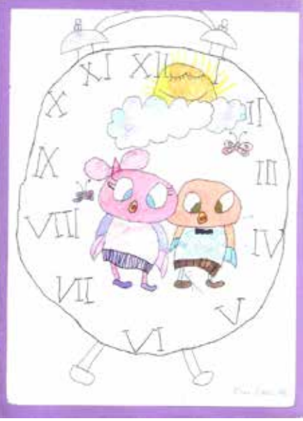
Onur Öztürk (Yaş 9)