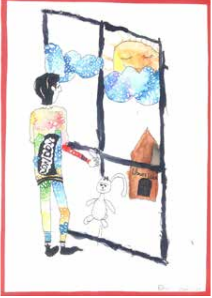
Onur Öztürk (Yaş 9)