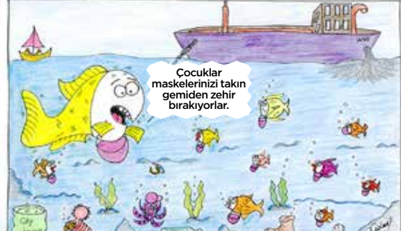
Zübeyde Coşkun (Yetişkin)