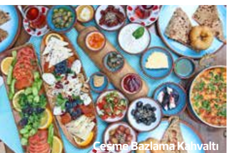
Çeşme Bazlama Kahvaltı